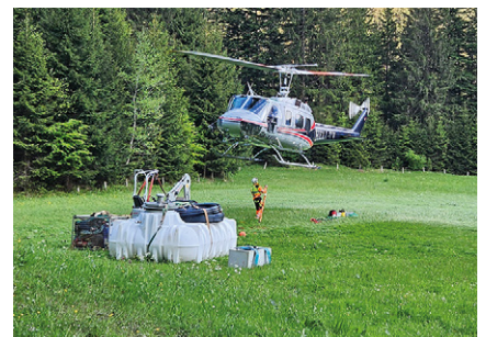
➤ Wasserversorgung Ochsenalpe