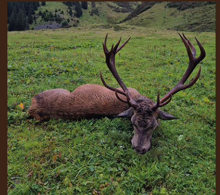
↘ erlegter Hirsch auf der Zaluanda

Der vorgegebene Mindestabschuss konnte zu 100 % erfüllt werden. Sämtliche entnommenen TBC-Proben waren negativ . Neben starken Hirschen gelang es uns auch, einen reifen Gamsbock zu erlegen. Zudem durfte ich in diesem Jahr Erich Plangg an einem wunderschönen Tag bei der Murmeltierjagd begleiten.