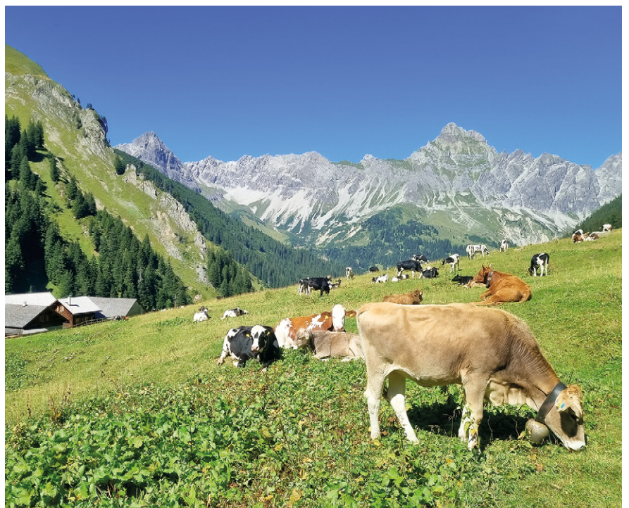
➤ Viehweide Alpe Salonien mit Blick zur Zimba