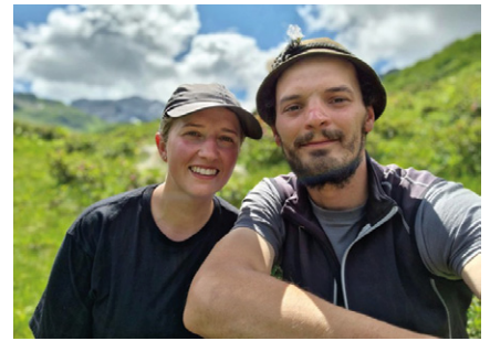
➤ Hirtenpaar der Alpe Salonien