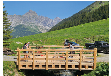
➤ Holzbrücke Rellsbach