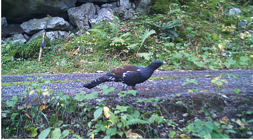
↗ Auerhahn (Wildkameraaufnahme)